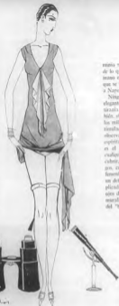
ILUSTRACION DE CARLOS

Así fue como el Imperio del Bloomer extendió su poder y su do-