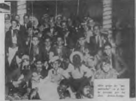
Una gran cantidad de mujeres de diferentes edades, desde las niñas de la escuela hasta las señoras de la casa, se reunieron en el salón de la escuela para celebrar el día de la mujer.