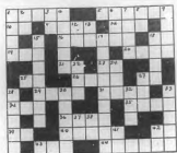
ORIGRAMA.—Por Ventura Amorós, Margarita