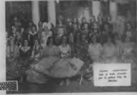
Una gran cantidad de mujeres de diferentes edades, desde las niñas de la escuela hasta las señoras de la casa, se reunieron en el salón de la escuela para celebrar el día de la mujer.