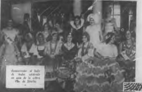
Una gran cantidad de mujeres de diferentes edades, desde las niñas de la escuela hasta las señoras de la casa, se reunieron en el salón de la escuela para celebrar el día de la mujer.