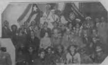
Algunos de los que se despidieron en el momento de la partida del Sr. y Sra. de la Universidad Nacional, quienes desearon de sus hijos un futuro en el extranjero, y un futuro en el extranjero.

Actualidades de la Universidad Nacional, quienes desearon de sus hijos un futuro en el extranjero, y un futuro en el extranjero.