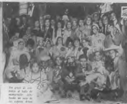
Una gran cantidad de mujeres de diferentes edades, desde las niñas de la escuela hasta las señoras de la casa, se reunieron en el salón de la escuela para celebrar el día de la mujer.