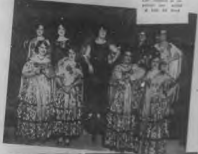
Una gran cantidad de mujeres de diferentes edades, desde las niñas de la escuela hasta las señoras de la casa, se reunieron en el salón de la escuela para celebrar el día de la mujer.