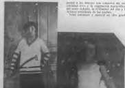
Figura número 9. Una línea de un tipo de línea, una línea de un tipo de línea.