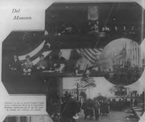
Algunos de los que se despidieron en el momento de la partida del Sr. y Sra. de la Universidad Nacional, quienes desearon de sus hijos un futuro en el extranjero, y un futuro en el extranjero.