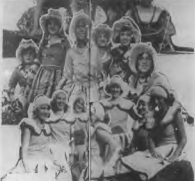
En esta fotografía se ven a las mujeres que se presentaron en el concurso de disfraces, en el salón de la escuela.